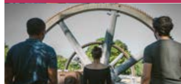
COMPAGNIE H.A.D GERMINAL - Les gens d'en-bas