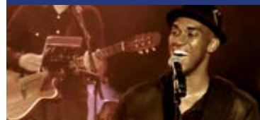
JF GANG In Love

COUP D'OEIL SUR LA SAISON CULTURELLE AOÛT DÉCEMBRE 2026