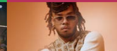
MARSHALL En live