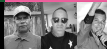
SAWRÉ SEGGAE SÉGA AIM'A NOU, CYCLON', MAPERINE