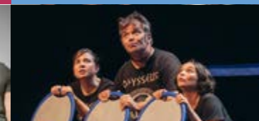
COMPAGNIE TAMAM ULYSSE à peu près