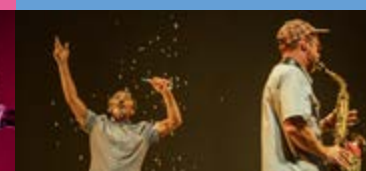
CIE THÉÂTRE BAZAR Bouches cousues

COUP D'OEIL SUR LA SAISON CULTURELLE AOÛT DÉCEMBRE 2026