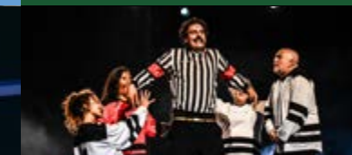
COMPAGNIE TAMAM ULYSSE à peu près