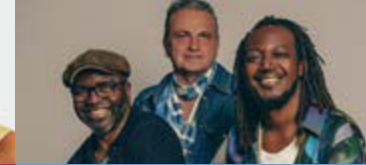
BLUES MARON FESTIVAL 3 ème édition SOBA BLUES TANIAMA (1 ère PARTIE)