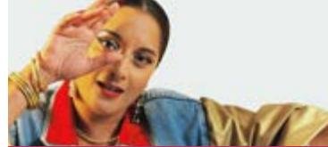
MAYA KAMATY Exotik

Directrice de publication Olivia Morel / Textes de présentation Jimmy Tossem / Design graphique Olive Design / Licences d'entrepreneur de spectacles D-2024-004349/50/60 / Impression NID - DL 16678