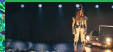
COLLECTIF LOOKATMEKID Un animal sauvage peut croiser votre route